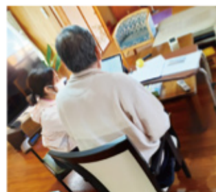
▲ICTで楽しく会話のリハビリ