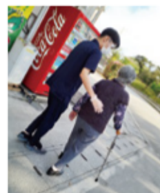
▲外出に向けての屋外歩行練習